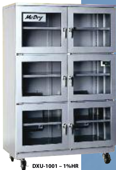
DXU-1001 - 1%HR