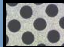
Después de Sawa limpiador de estencil