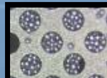
Antes de Sawa limpiador de estencil