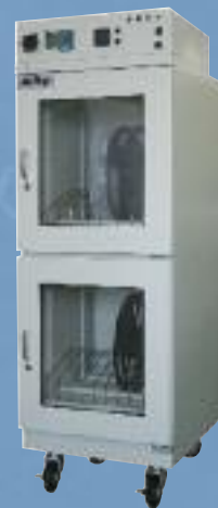
MB-301 Gabinete de cocción baja temperatura