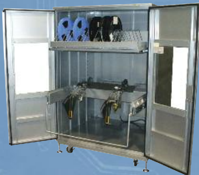
DXU-1002-1000 Gabinete para alimentadores