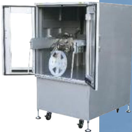
DXU-580 Gabinete para alimentador